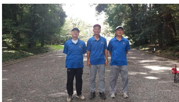
第3位 足利 B チーム