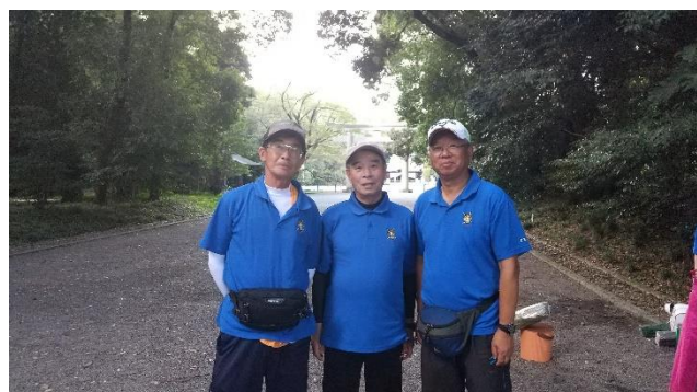
第3位 足利 A チーム